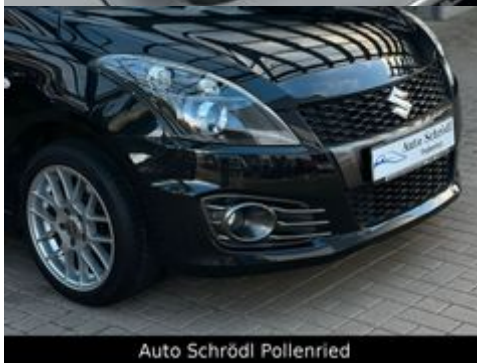
Auto Schrödl Pollenried