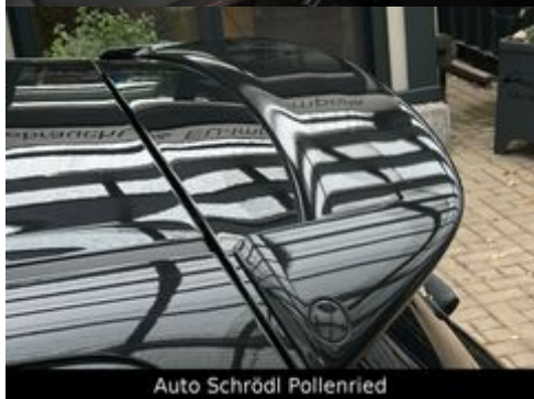
Auto Schrödl Pollenried