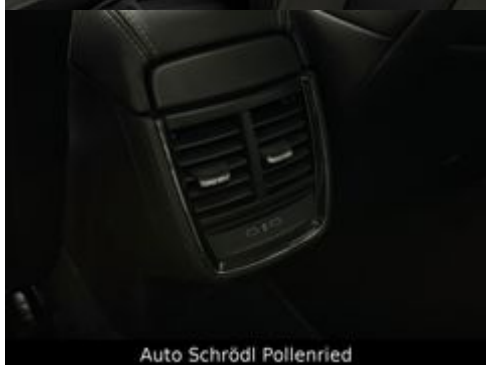
Auto Schrödl Pollenried