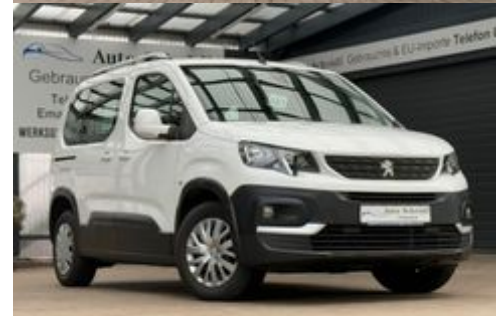
Auto Schrödl Pollenried