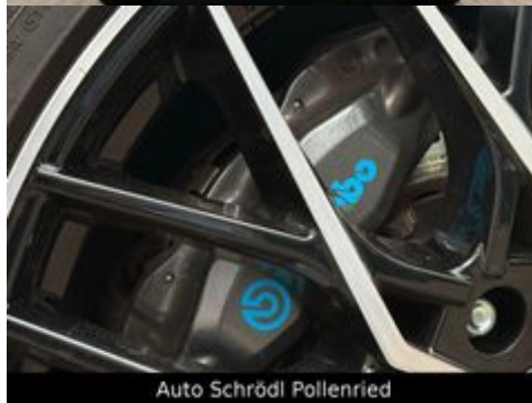
Auto Schrödl Pollenried