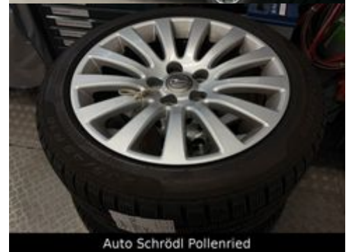
Auto Schrödl Pollenried