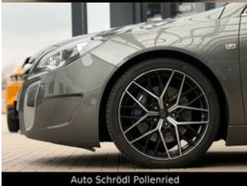
Auto Schrödl Pollenried