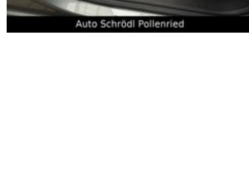
Auto Schrödl Pollenried