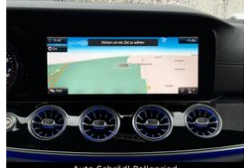
Auto Schrödl Pollenried