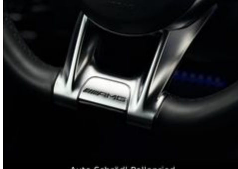
Auto Schrödl Pollenried