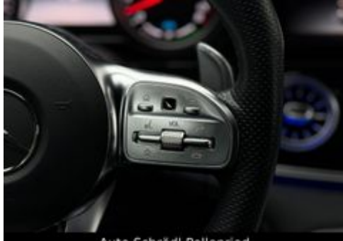
Auto Schrödl Pollenried