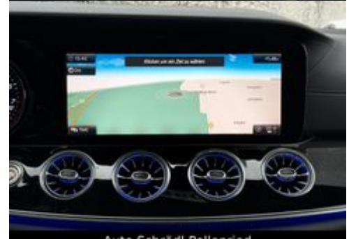
Auto Schrödl Pollenried