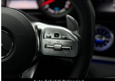
Auto Schrödl Pollenried