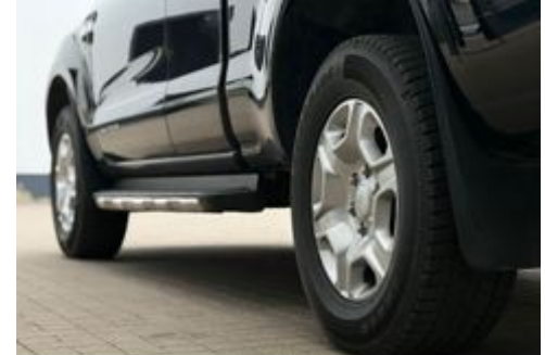
Auto Schrödl Pollenried