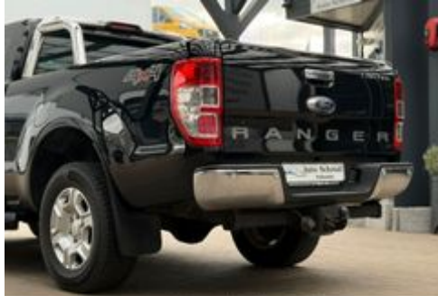
Auto Schrödl Pollenried

! BITTE BESCHREIBUNG BEACHTEN ! VERKAUF NUR AN GEWERBE & EXPORT ! PLEASE READ THE DESCRIPTION ! ONLY FOR B2B & EXPORT