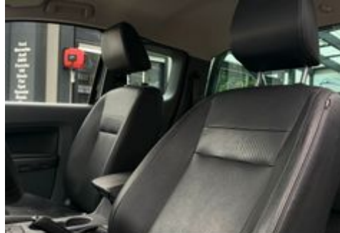
Auto Schrödl Pollenried