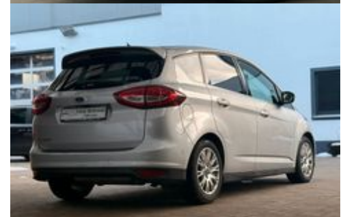
Auto Schrödl Pollenried