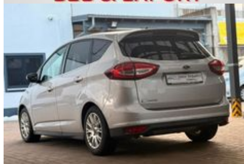
Auto Schrödl Pollenried