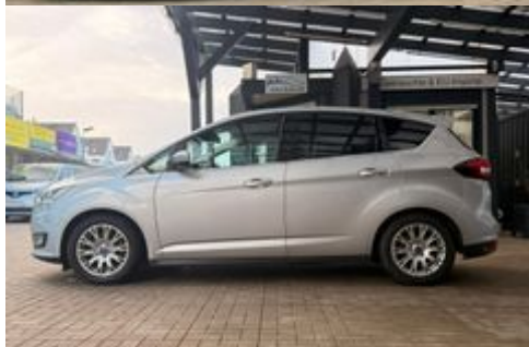
Auto Schrödl Pollenried